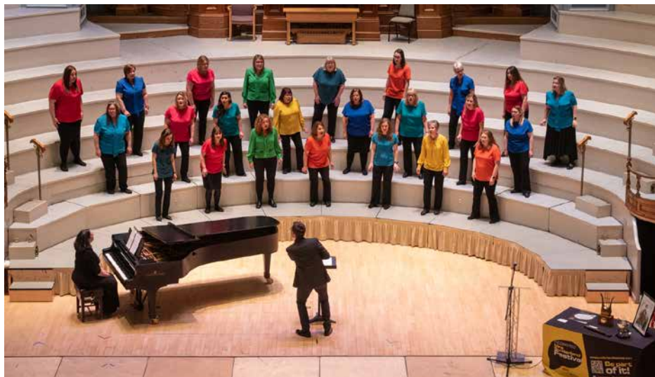
PETERBOROUGH VOICES Peterborough, Lielbritānija / Great Britain