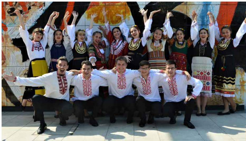
OHANA Sofia, Bulgārija / Bulgaria