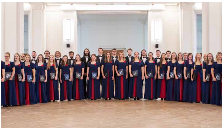
AKADEMICKI CHÓR POLITECHNIKI GDAŃSKIEJ Gdańsk, Polija / Poland