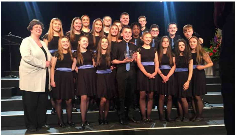
CONTINUUM YOUTH CHOIR Dublin, Īrija / Ireland