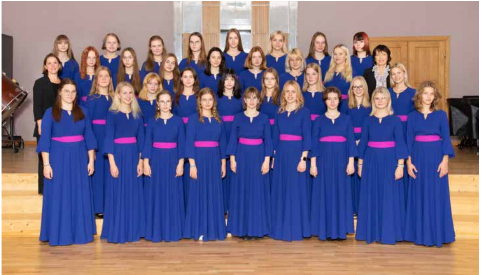
YOUTH CHOIR OF TALLINN MUSIC HIGH SCHOOL Tallinn, Igaunija / Estonia